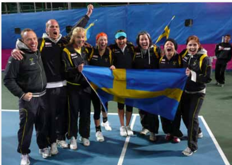
Glädje i Fed Cup-laget efter avancemanget i Israel.