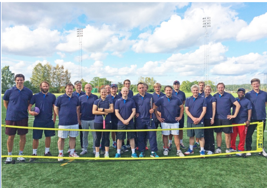
Några av Svenska Tennisförbundets kursledare.