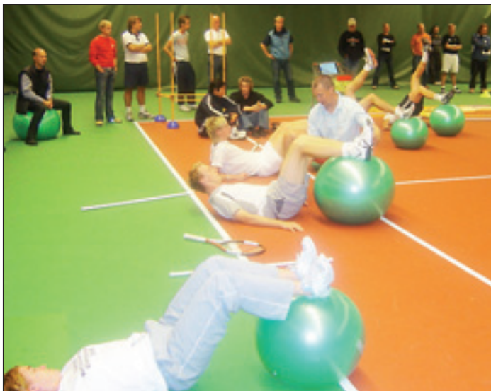
"Prova-på" under Tennissymposiet.

Fysträning och skadeförebyggande träning har en