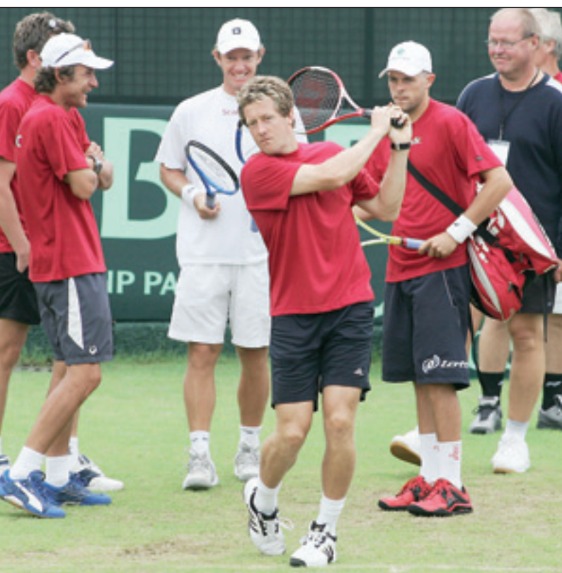
DC-playoff i Indien. Laget testar gräsbanan efter regnet.

Sverige var återigen inte seedat och lottades mot stormakten Frankrike i den första omgången. Fransmännen valde som väntat att spela på inomhusgrus och lyckades vinna den rafflande matchen med 3-2. Det blev hemmasonen Paul-Henri Mathieu som blev den stora hjälten i Strasbourg. Mathieu inledde med att besegra