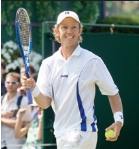
Thomas Johansson i semifinal i Wimbledon.