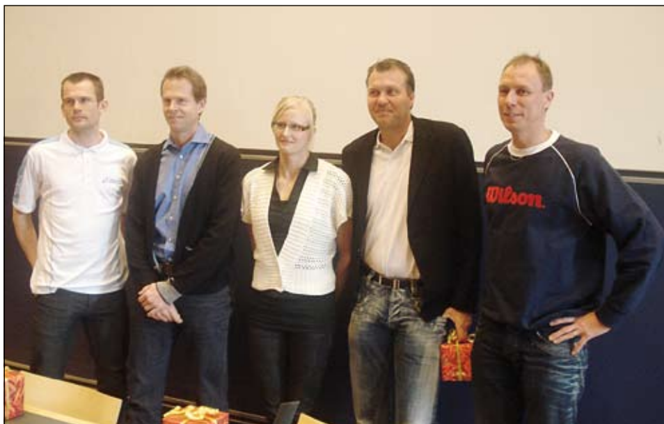
"On the road to success"

Sammanlagt lockade konferensen 100 deltagare varav cirka 60 hade tennisen som huvudsyssla. Att på detta sätt samverka med andra organisationer och förbund gav mersmak och redan efter konferensens avslutning påbörjades tankar inför nästa konferens.