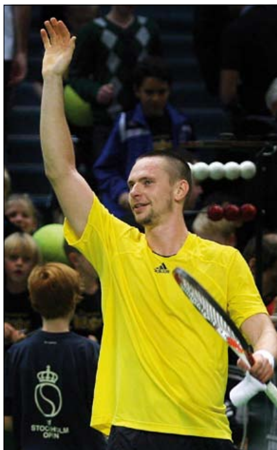
Årets tennissvensk, Robin Söderling