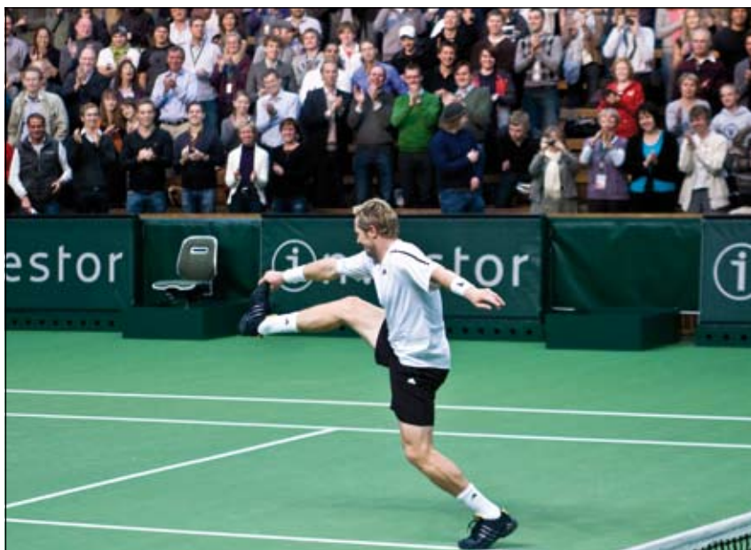
Jonas Björkmans "Brysselsteg".

Fredagens första match spelades mellan David Nalbandian och Thomas Johansson. Tompa gjorde här en mycket stark insats och skakade om Nalbandian ordentligt. Till slut stod dock argentinaren som segrare i 4:e set efter en tuff kamp. Robin fick möta José Acasuso i fredagens andra singel. Argentina var