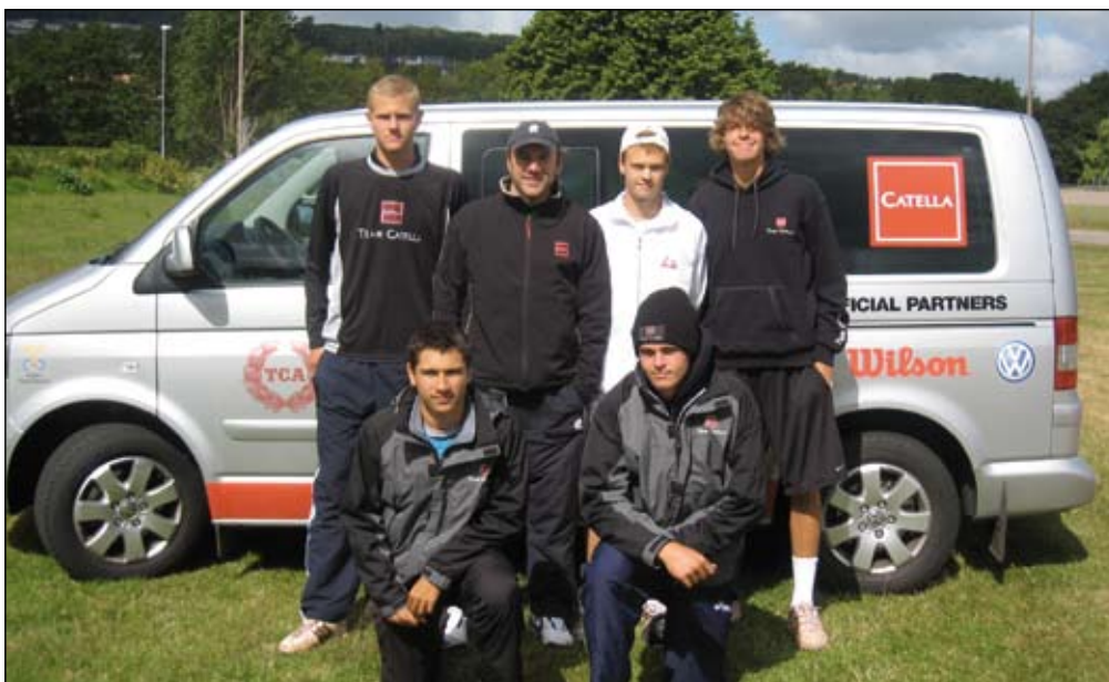
Team Catella on Tour

Det är också angeläget att tacka alla ideella ledare i klubbar och distrikt. Otaliga är de timmar som på ideell basis läggs ned i distriktsförbund, klubbar och centralt, i syfte att utveckla vår sport och främst de ungdomar som väljer att utöva den.