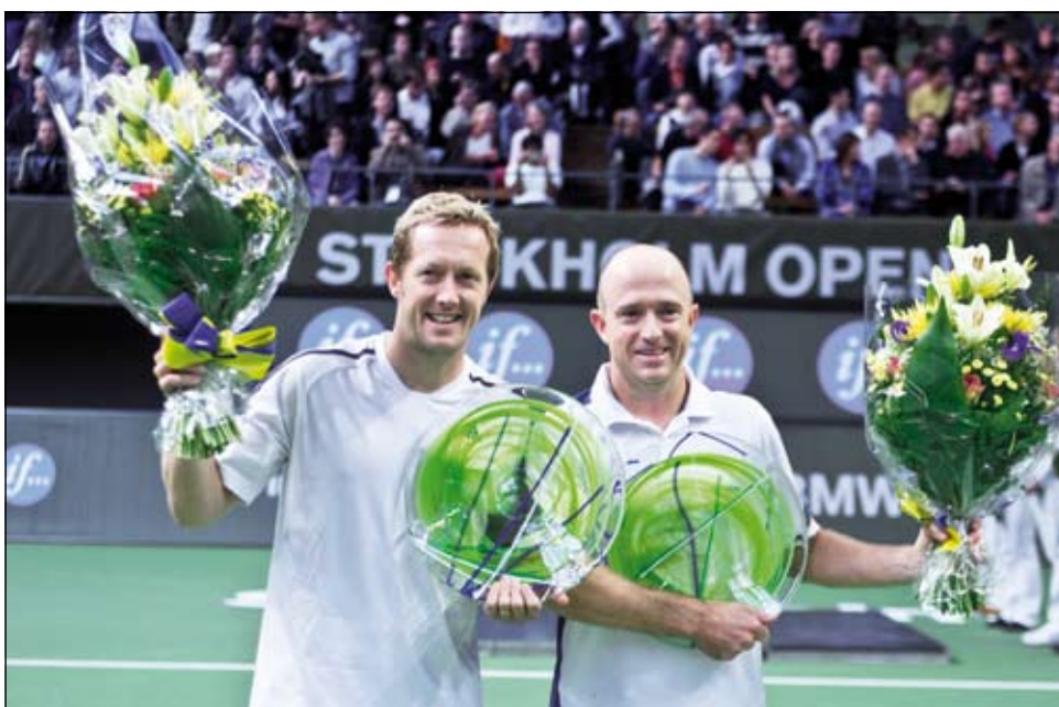
Jonas Björkman vann dubbelfinalen i sin sista Stockholm Open tillsammans med Kevin Ullyett.