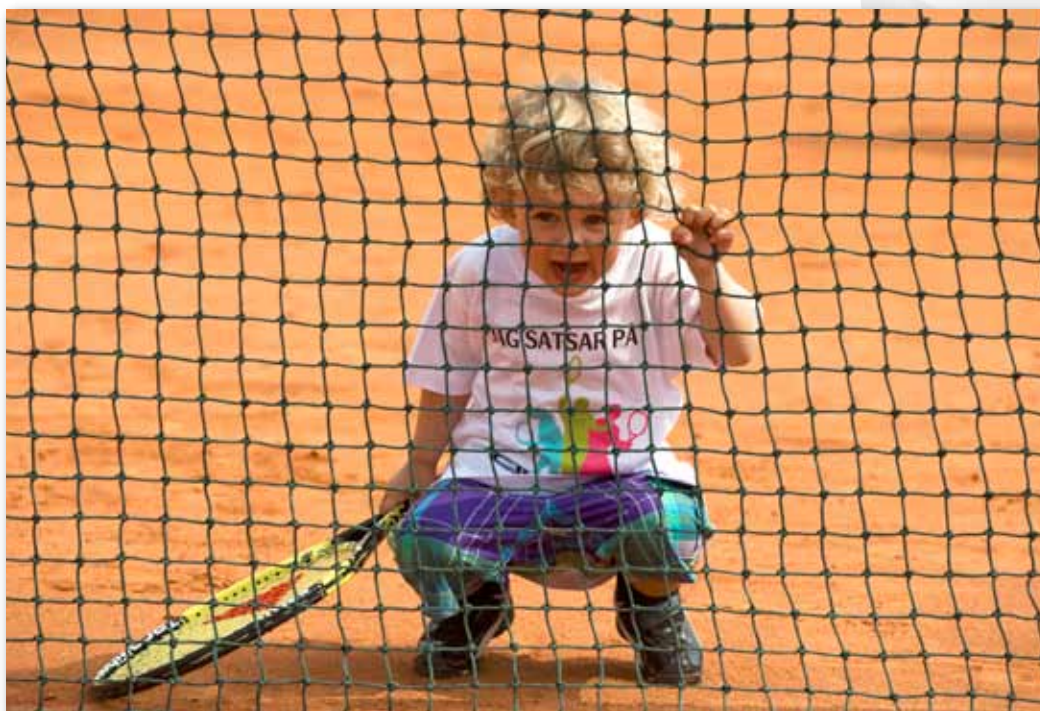
Play& Stay