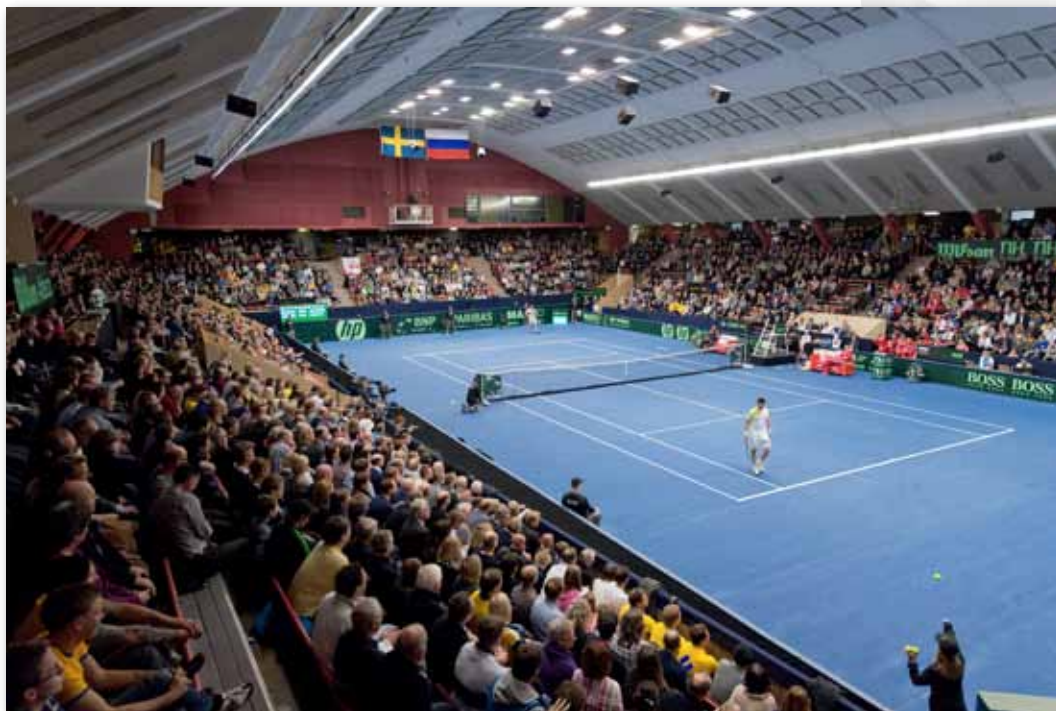
DC-match i Boråsballen

sedan fastställdes av Förbundsstyrelsen, var vilka områden som skulle prioriteras vad gäller användningen av de resurser tennisen får från RF via Idrottslyftet. En viktig del i detta beslut var att sätta till extra resurser via just Idrottslyftet till "U14", dvs klubbarnas och regionernas arbete med de ungdomar som är 14 år och yngre och som inte är med i den begränsade del, i princip endast landslagsverksamheten som Förbundet har hand om.