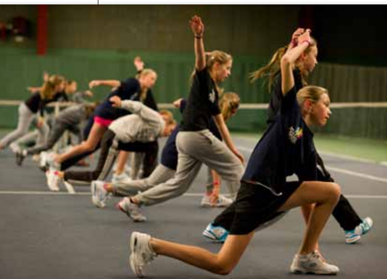
SEB Next Generationläger

Tennisen är redan idag en av Sveriges största och mest aktiva barn- och ungdomsidrotter. Genom våra många föreningar har vi en tillgång till egna träningsanläggningar som är unik i sitt slag, såväl i jämförelsen med andra idrotter i Sverige som med andra tennisationer i världen. Endast fotbollen har idag en bättre geografisk täckning än tennisen i Sverige.