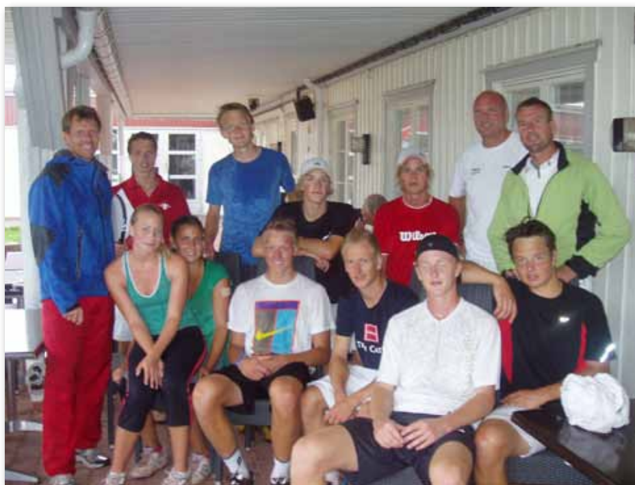
Elever och lärare vid Riksidrottsgymnasiet i Båstad