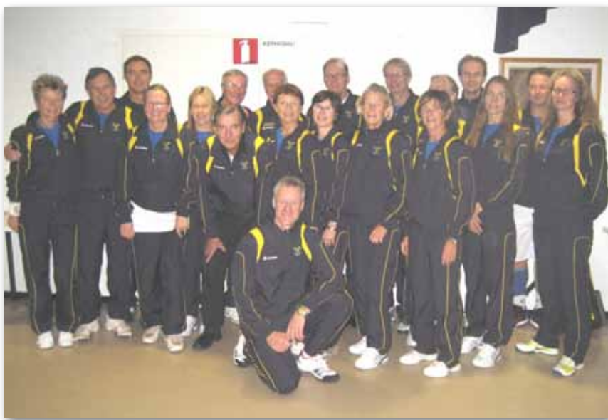
Svenska laget vid Nordiska Veteranmästerskapen i Helsingfors.