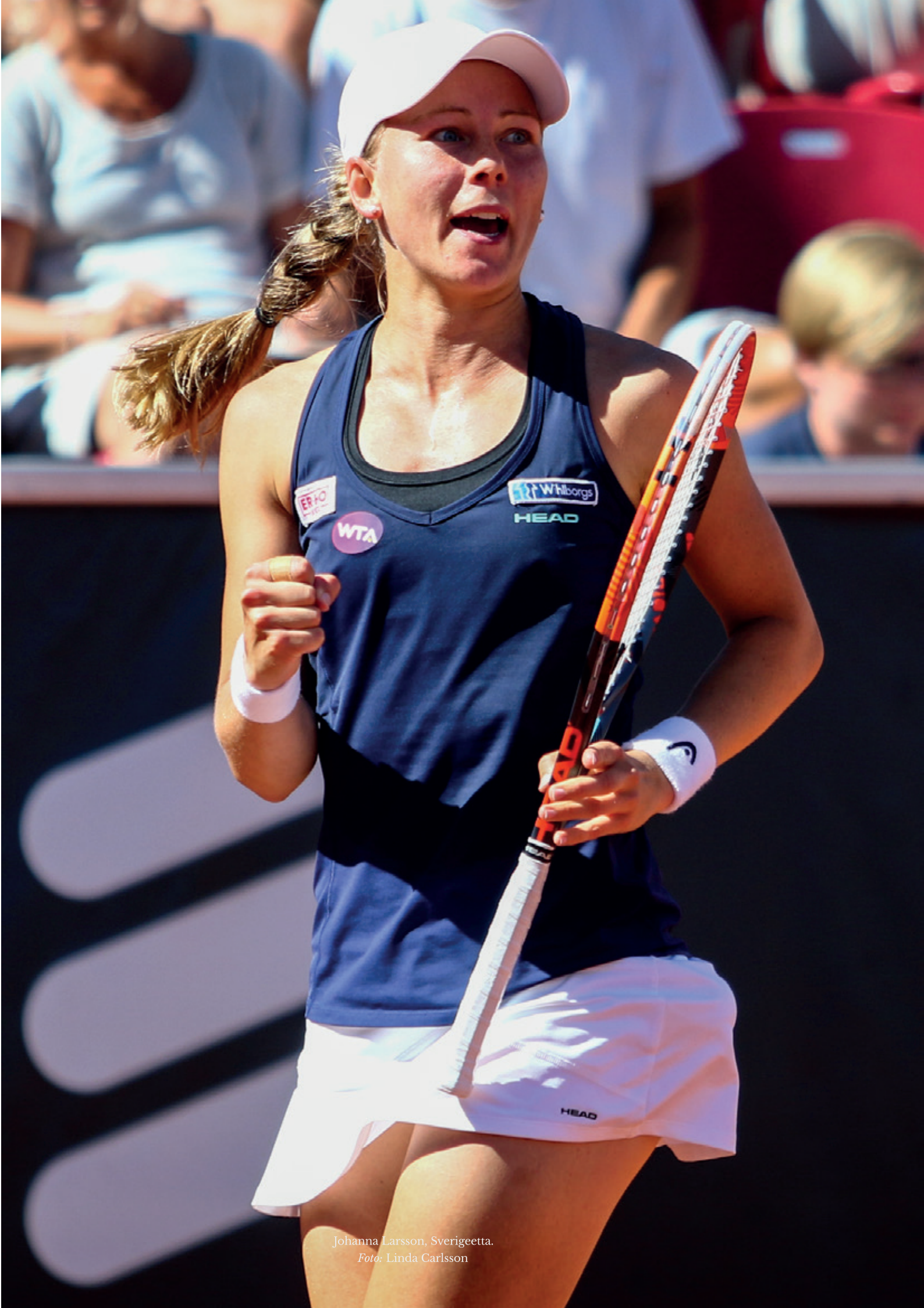
Johanna Larsson, Sverigeetta.