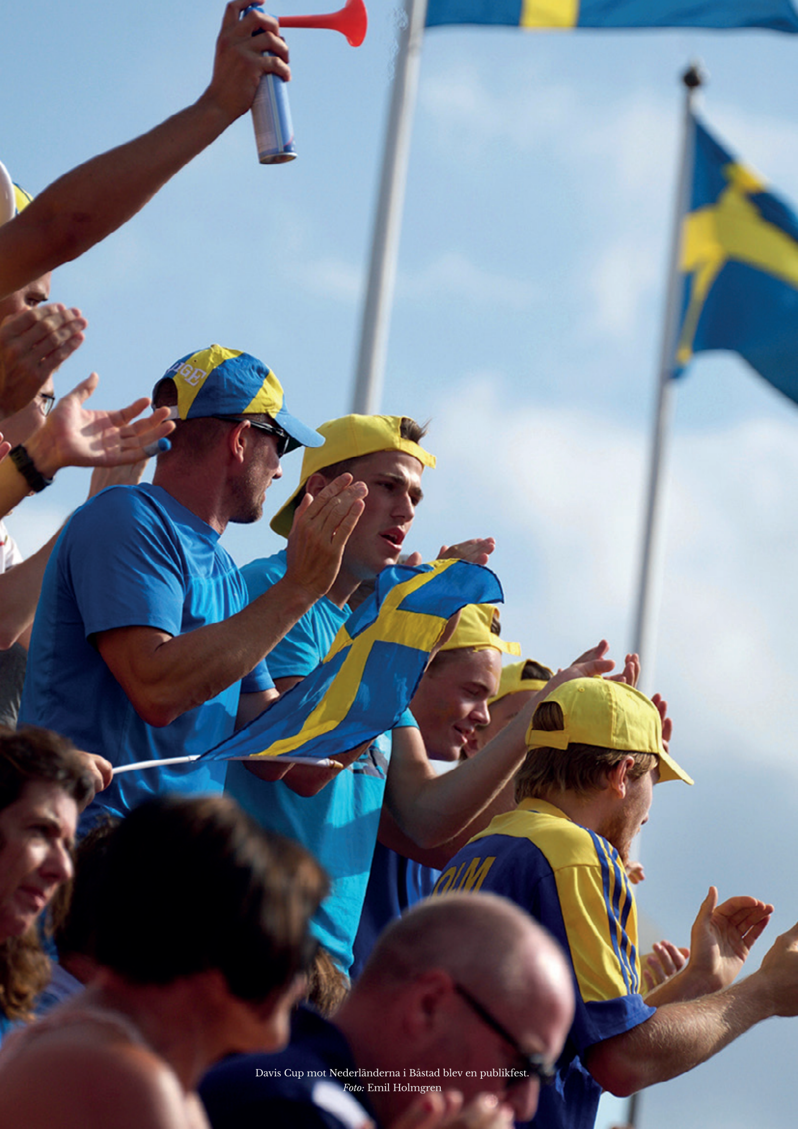
Davis Cup mot Nederländerna i Båstad blev en publikfest.