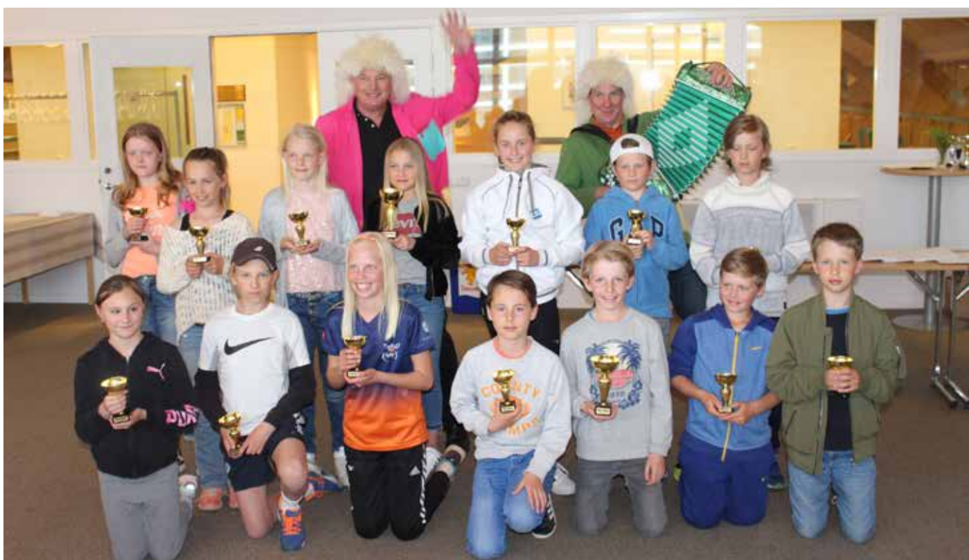
Många pristagare vid Allgott & Villgott Cup 2017