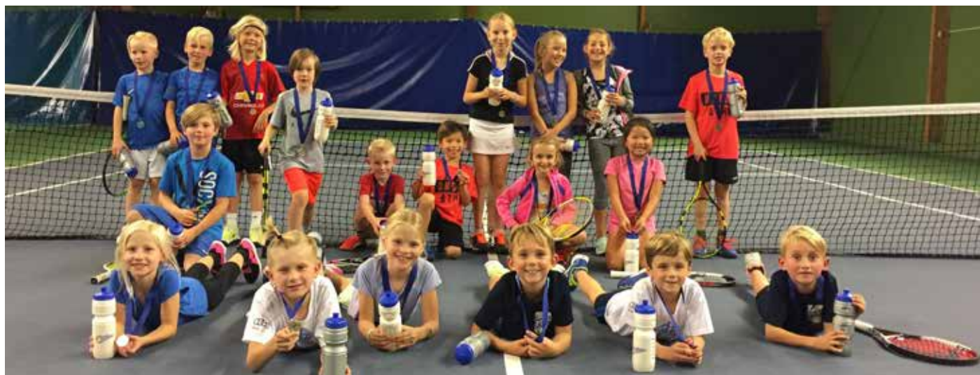
Påvelunds TBK segrade i Lilla Klubbturen hösten 2017.