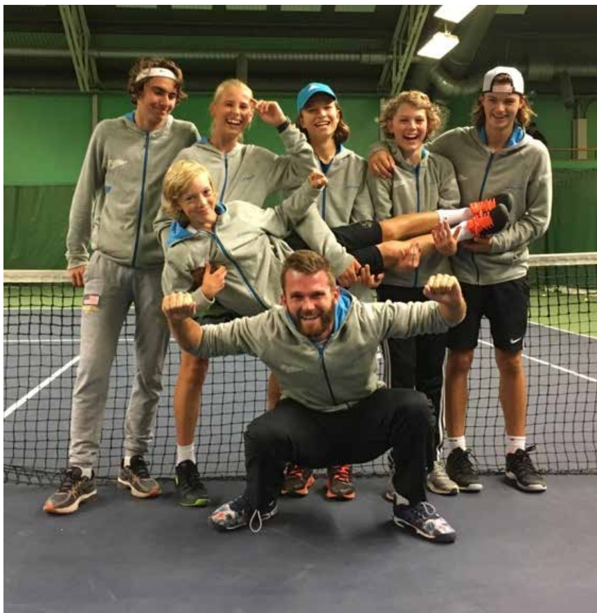
Göteborgs Pirres Pokallag som nådde final i den prestigefyllda regionlagtävlingen för pojkar 14 år.