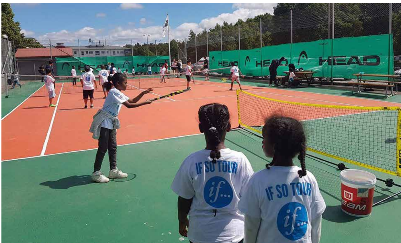
Full aktivitet vid Hammarkullens sommartenniskola