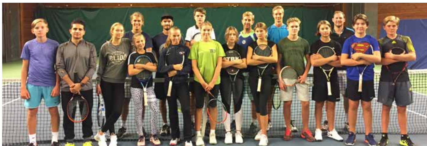
Kursdeltagarna vid Plattformen hösten 2017