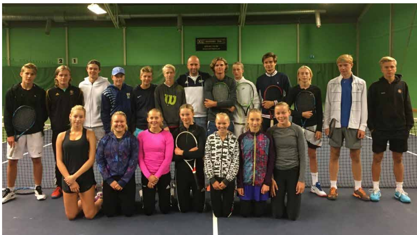
Tennis Göteborgs och Tennis Västs spelare samlade i samband med regionsmatchen 2017.