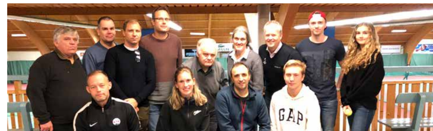
Deltagarna vid Match- och Tävlingsledarutbildning.