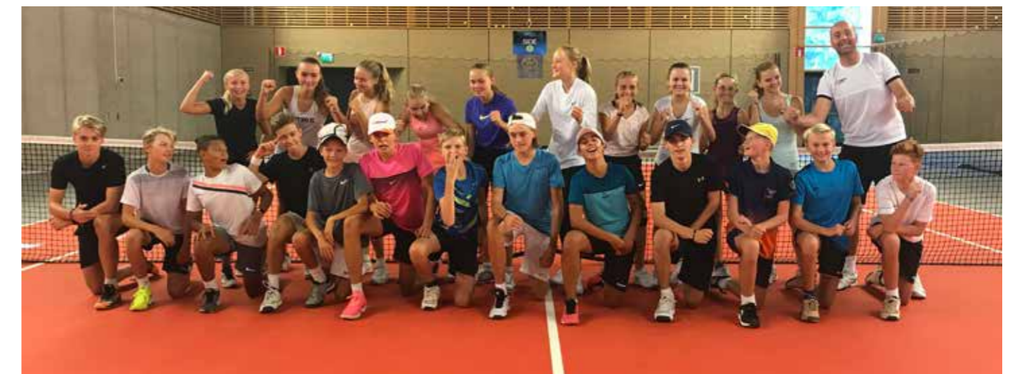
Elite Hotels Next Generation utbildningsläger