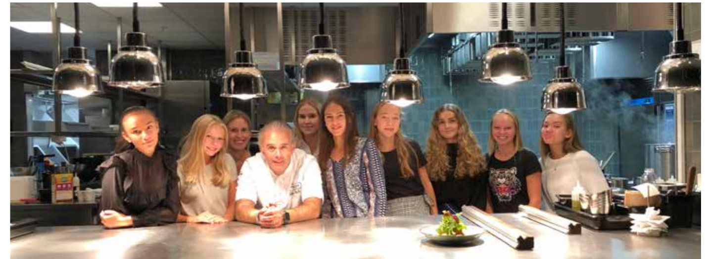
Projektet Tjejresan startade med en Kick-Off på restaurang at Park.