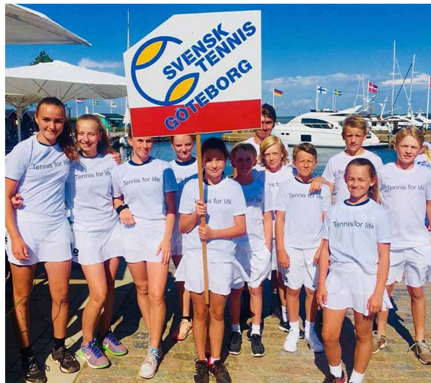
Göteborgs lag i Sverigefinalen av Elite Hotels Next Generation i Båstad