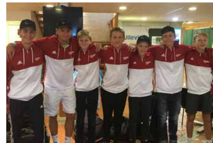
Göteborgs lag vid Pirres Pokal.