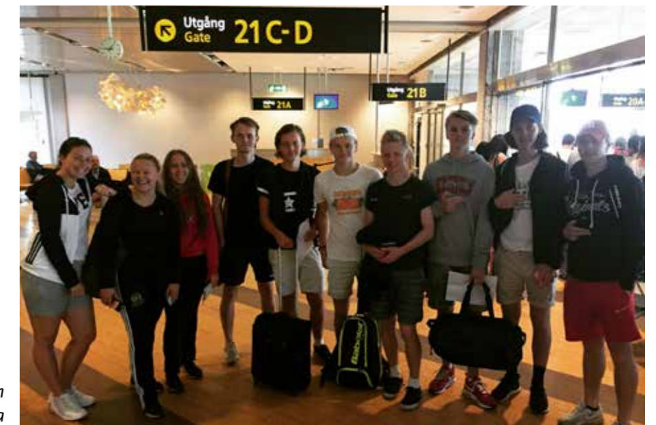
Göteborgs Tennisgymnasium på tävlingsresa