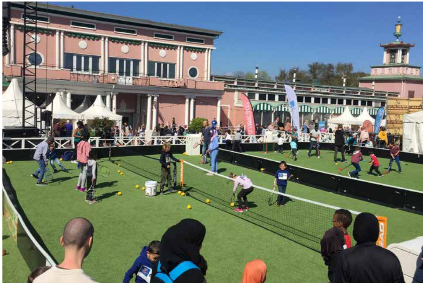
Full aktivitet vid Olympic Days på Liseberg

Stockholm den 15 februari 2019 Svenska Tennisförbundet Förbundsstyrelsen