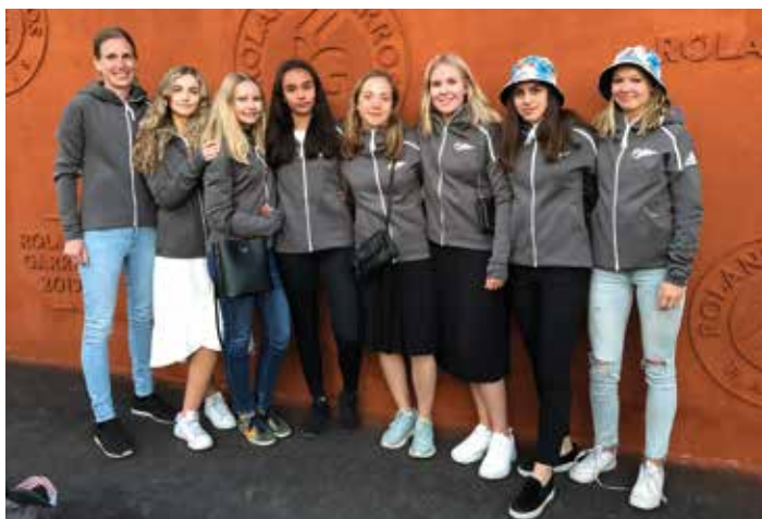
Tjejresan på Roland Garros i Paris.