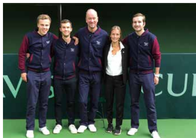
Flera Göteborgsdomare under Davis Cup.