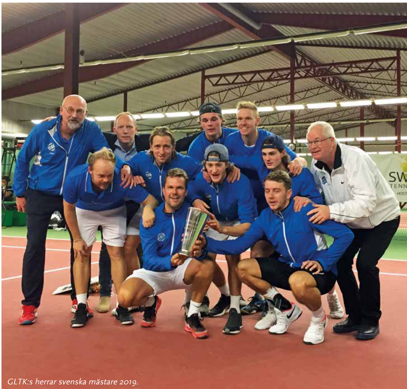
GLTK:s herrar svenska mästare 2019.