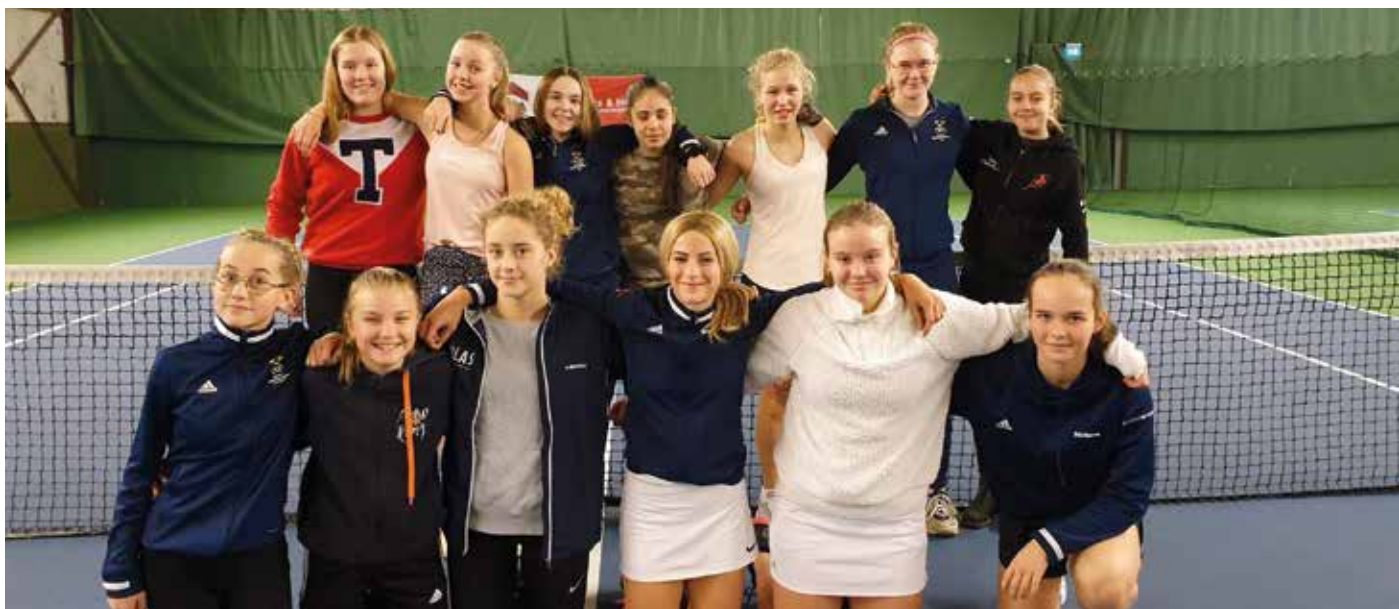
Matchutbyte mellan SvTF Göteborgs och SvTF Västs flickor 14.