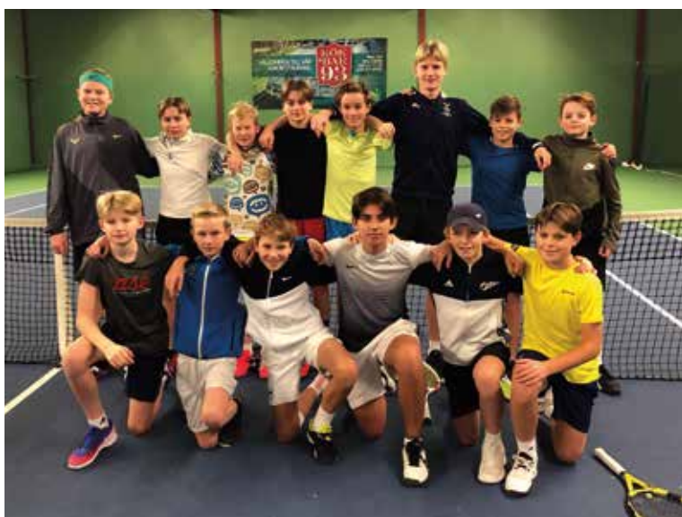
Matchutbyte mellan SvTF Göteborgs och SvTF Västs pojkar 14.