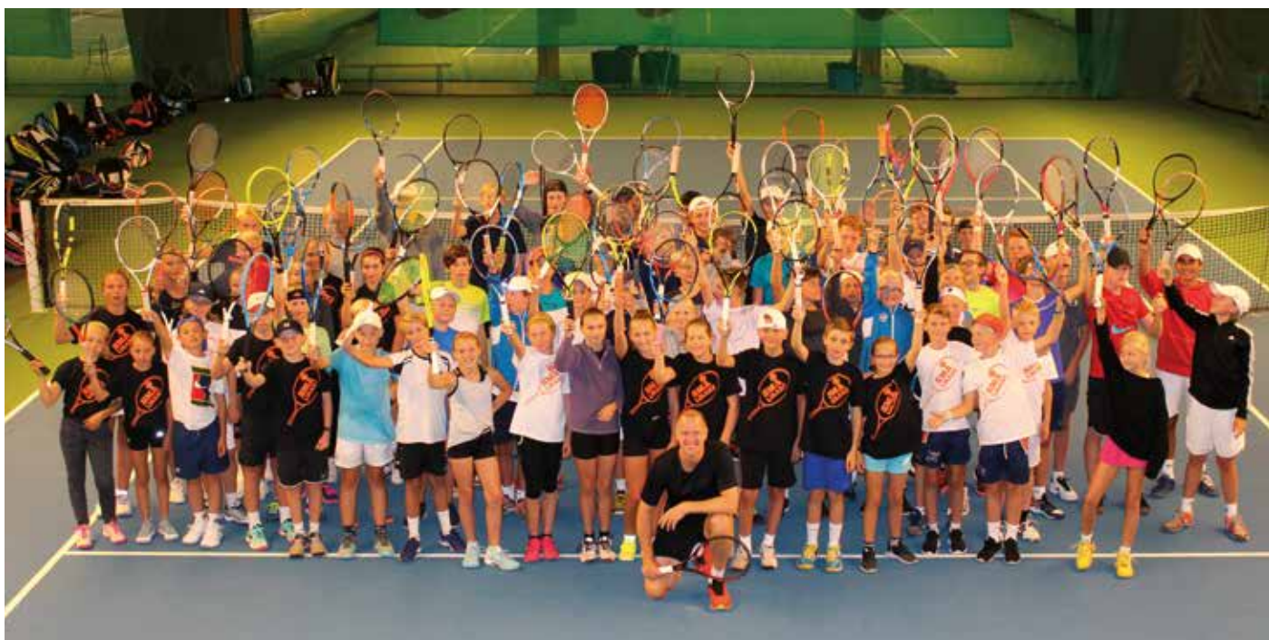
Små Lirare-träff hösten 2019.

Antalet medlemmar grundar sig på uppgifter som är rapporterade till Svenska Tennisförbundet per den 31 december 2019.