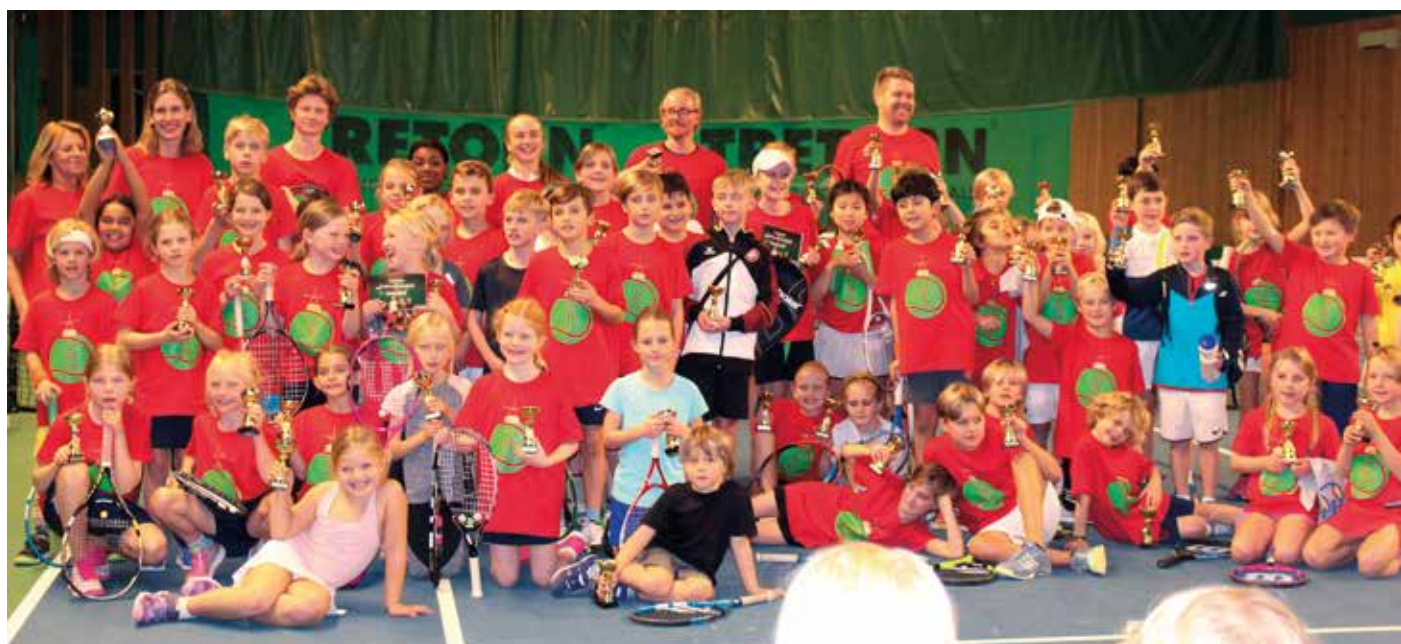
Jubileumstävling i Lilla Klubbturen.