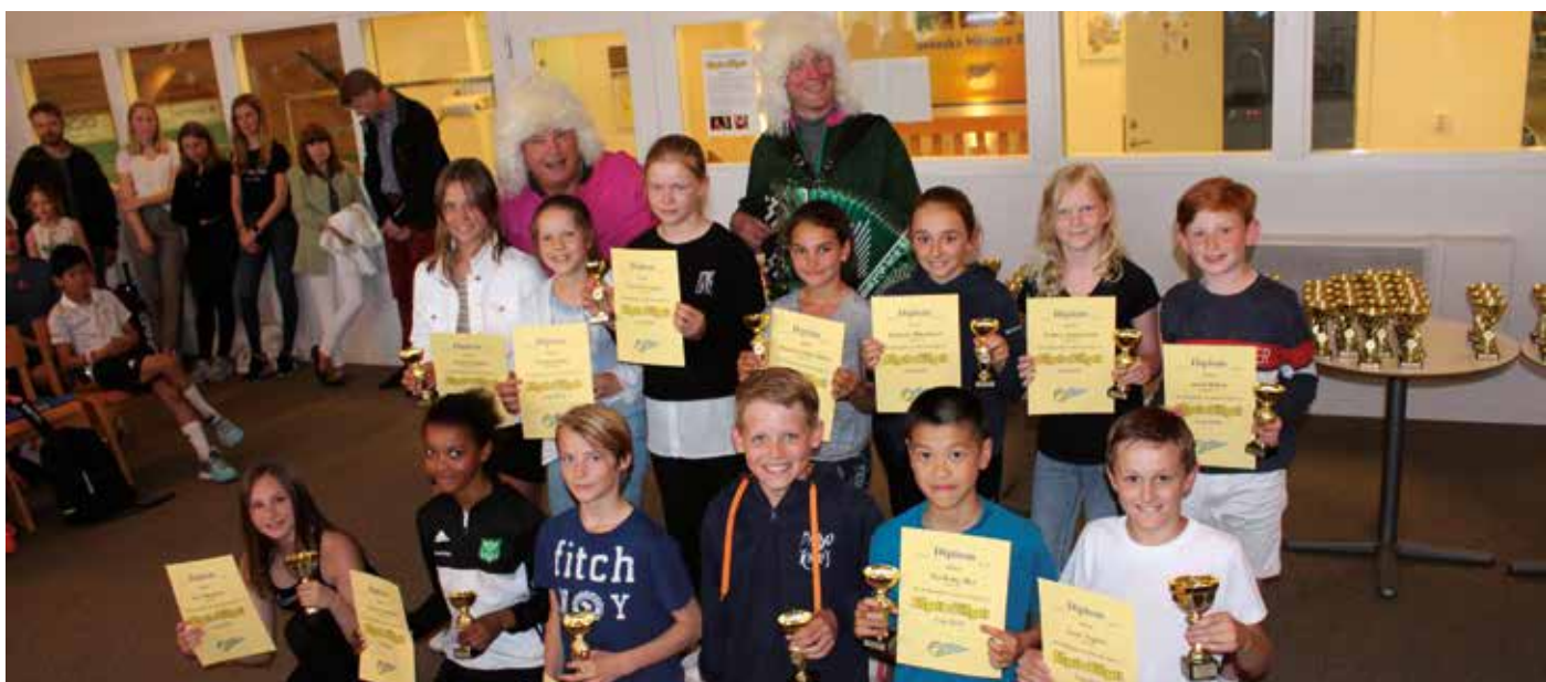
Prisutdelning i Allgott & Villgott cup