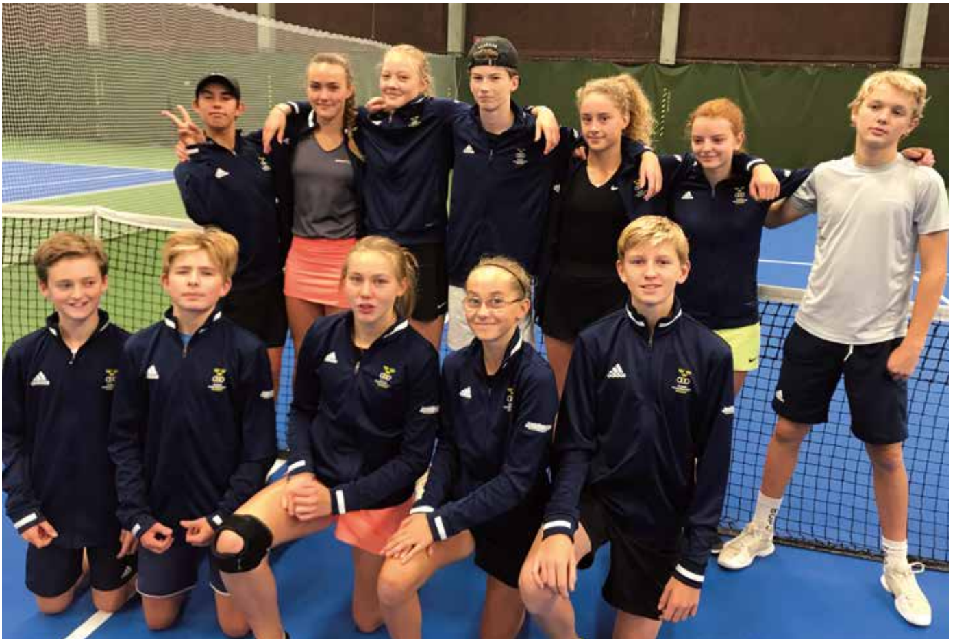
Göteborgslagen samlade i Norrköping för de årliga regionlagstävlingarna Sofias Cup och Pirres Pokal.