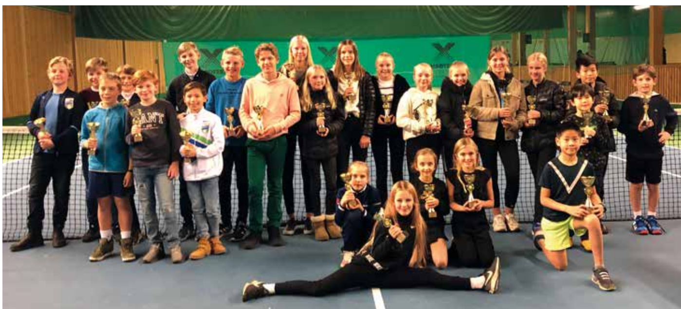
Pristagare vid Göteborgs Juniorserie utomhus.