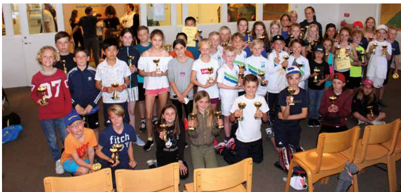
Pristagare vid Göteborgs Juniorserie inomhus.