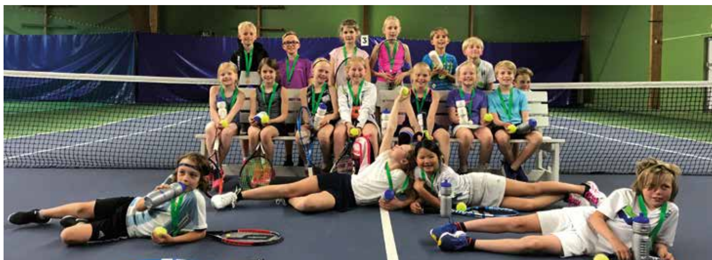
Påvelunds TBK segrade i Klubbturen både vårterminen och höstterminen.