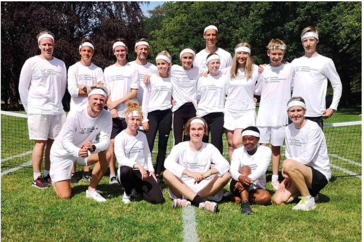
Många unga ledare vid sommareventet "Tennis i Slottsskogen"