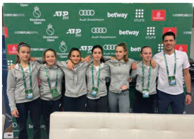
Sofias Cup-tjejerna kvalificerade sig till den stora finalen under Stockholm Open.