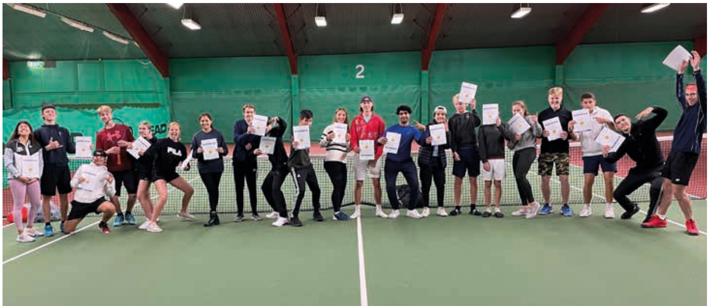
Nya tränare utbildade.