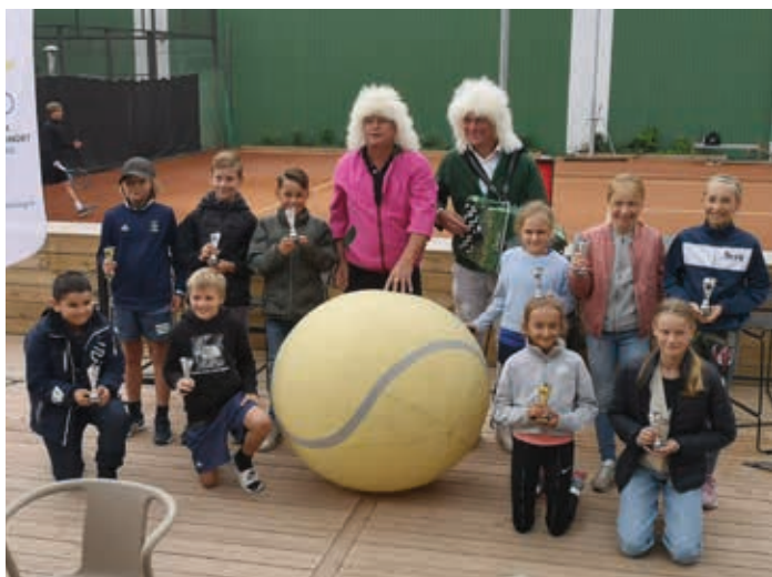
Prisutdelning Allgott & Villgott Cup.