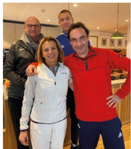
Göteborgs nyutbildade kursledare.