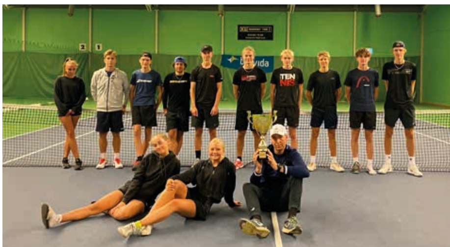
Göteborg vann regionsmatchen mot Väst.