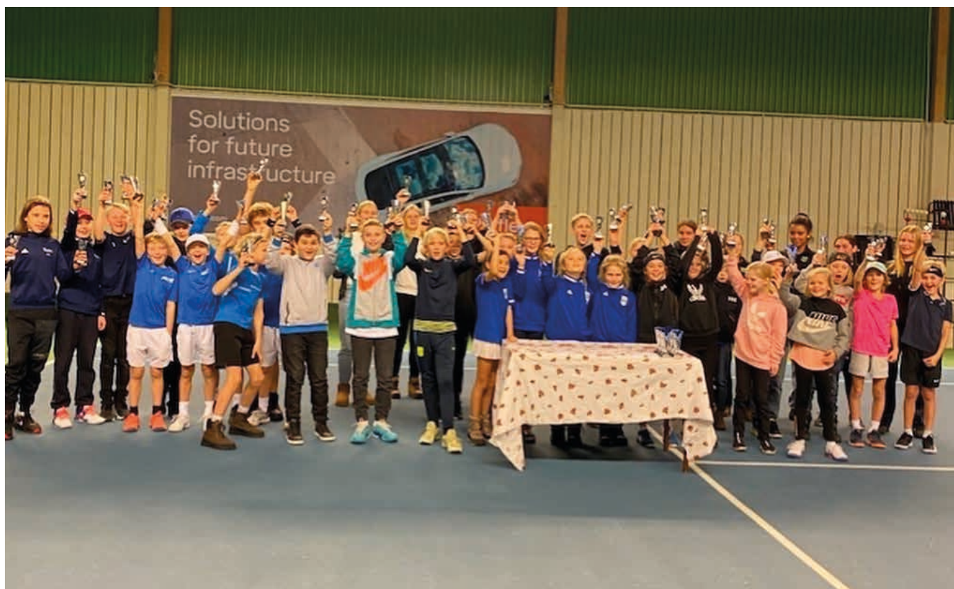
Många pristagare från Juniorserien utomhus.

Information från SvTF Göteborg och om göteborgstennisen i allmänhet har givits ut i tidningen Göteborgstennis, vilket är SvTF Göteborgs officiella organ. Denna tidning har kommit ut med ett nummer under året. Tidningarna har distribuerats till regionens olika tennishallar. SvTF Göteborg använder sociala medier genom Instagram för att regelbundet kommunicera tennisen. Dessutom finns mycket information att finna på SvTF Göteborgs hemsida med adressen www.tennisingoteborg.se .