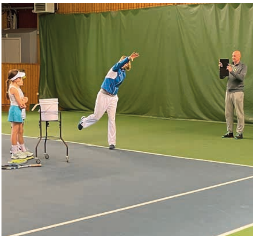
Filminspelning pågår till tränarutvecklingsprojektet.

Styrelsen anser, med tanke på de aktiviteter som utförts i regionens klubbar och SvTF Göteborg att vi väl uppnår de övergripande målen.