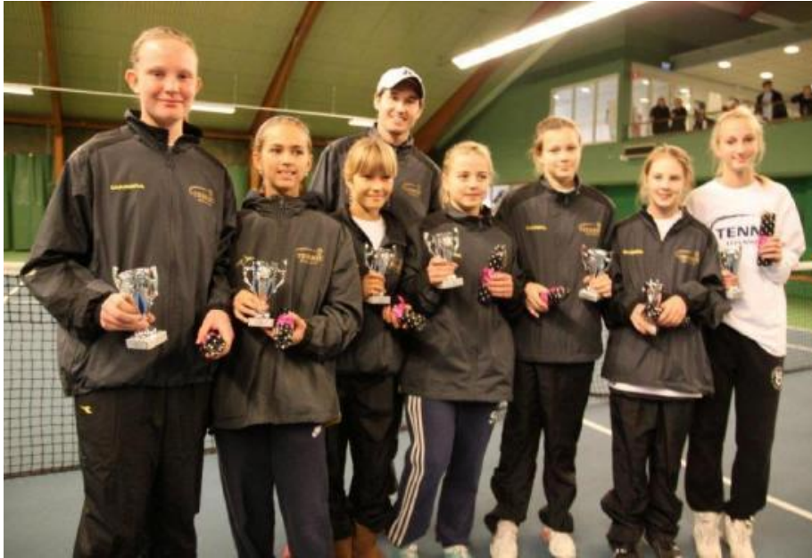
Investor Cup laget