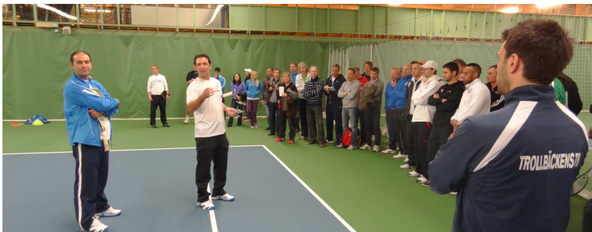
Workshop med Barcelona Tennis Academy tränarna

Vi tackar SALK för att vi har fått köra Plattformen för tennis i SEB SALK Hallen och vi ser gärna att vi även får hyra andra klubbars faciliteter framöver så vi kan sprida denna viktiga gärning även geografiskt.