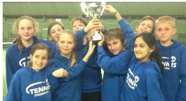
SALK – "Rookies Of The Year"

Totalt deltog 28 lag i Rookie Guld och Rookie Silver.