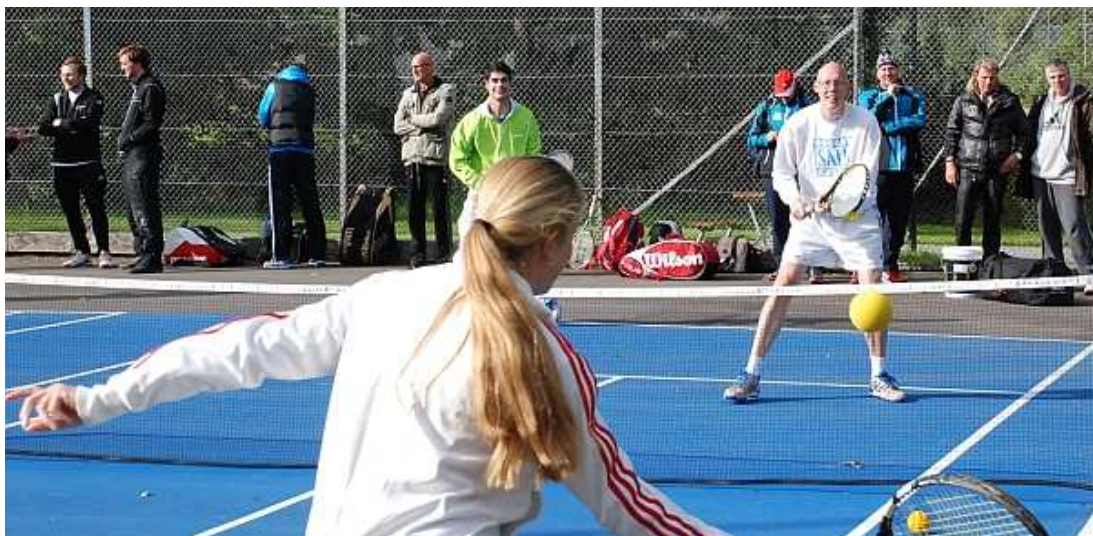
Tränarträff på Vårby Gärd

Vi tackar samtliga tennishallar som hjälpt till med service runt arrangemanget av kurserna.