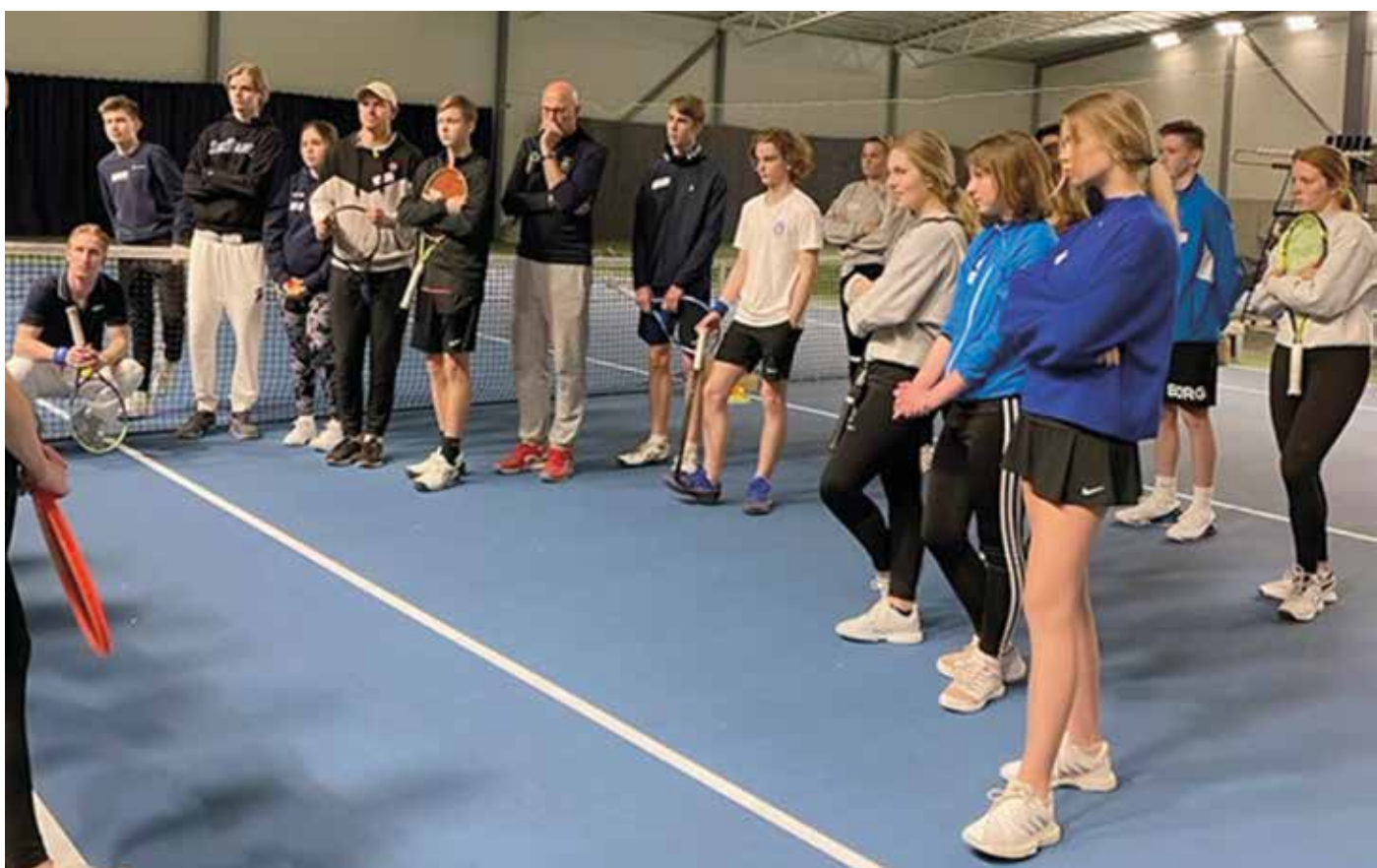
Presentation av träning under Bastränarutbildning.