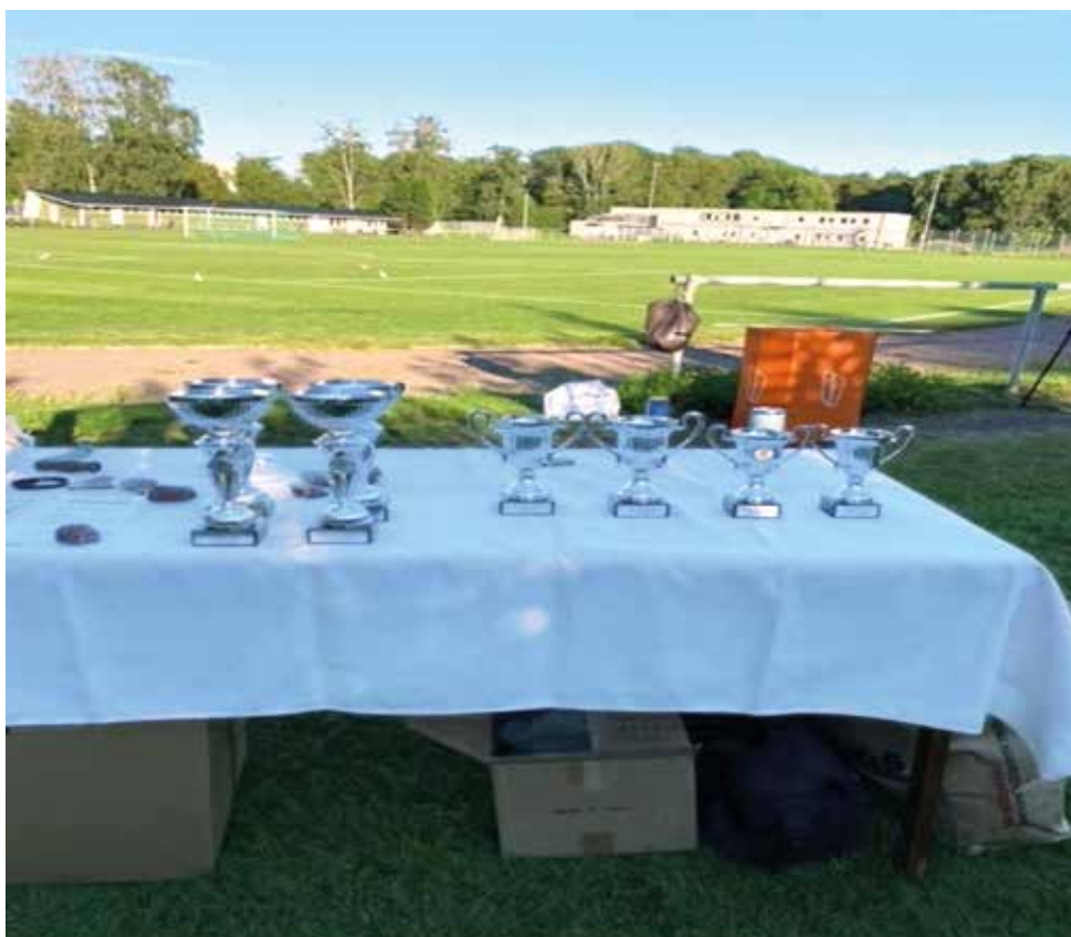
Prisbord RM ute 2022.