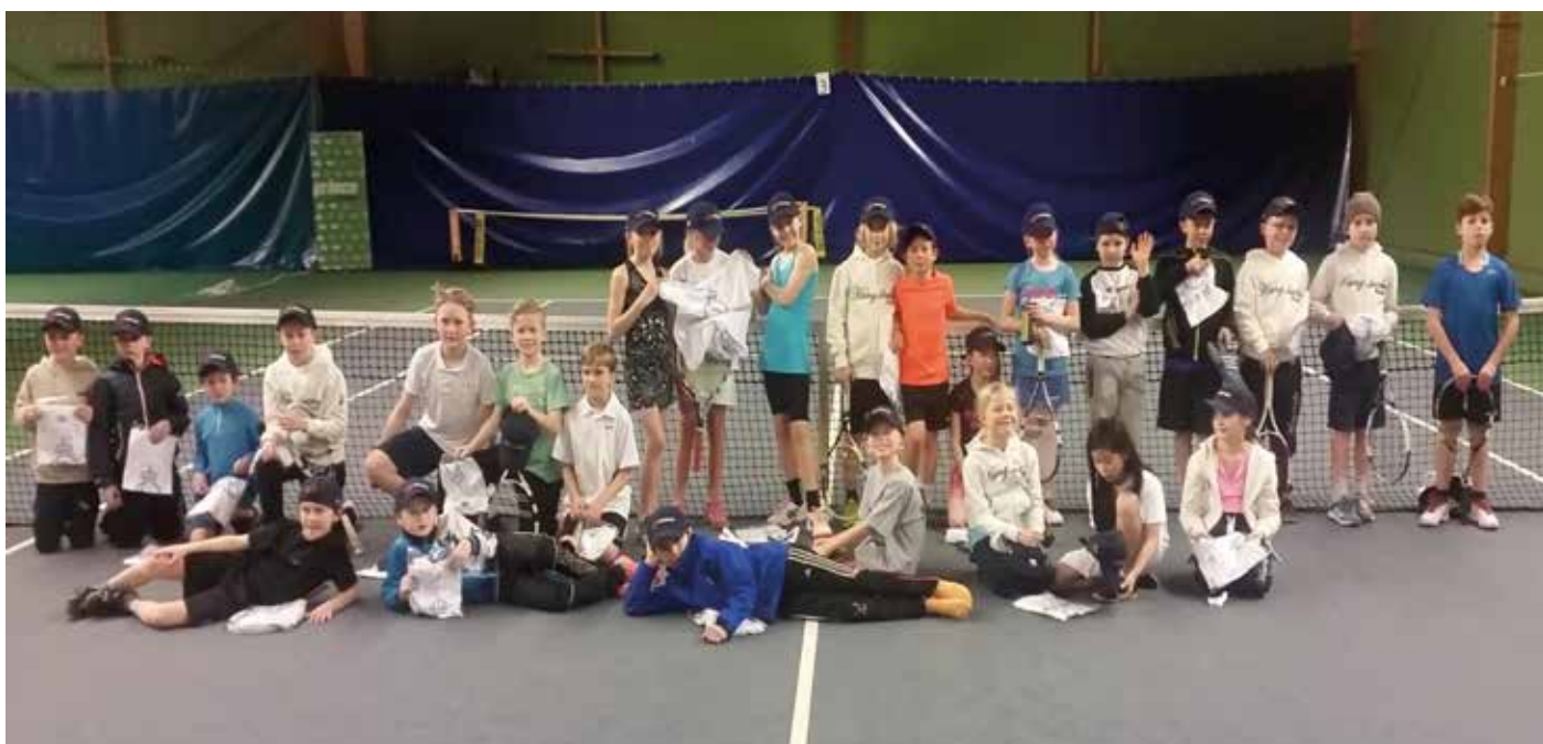
Glada barn på en av de många tävlingarna inom Lilla Klubbturen.