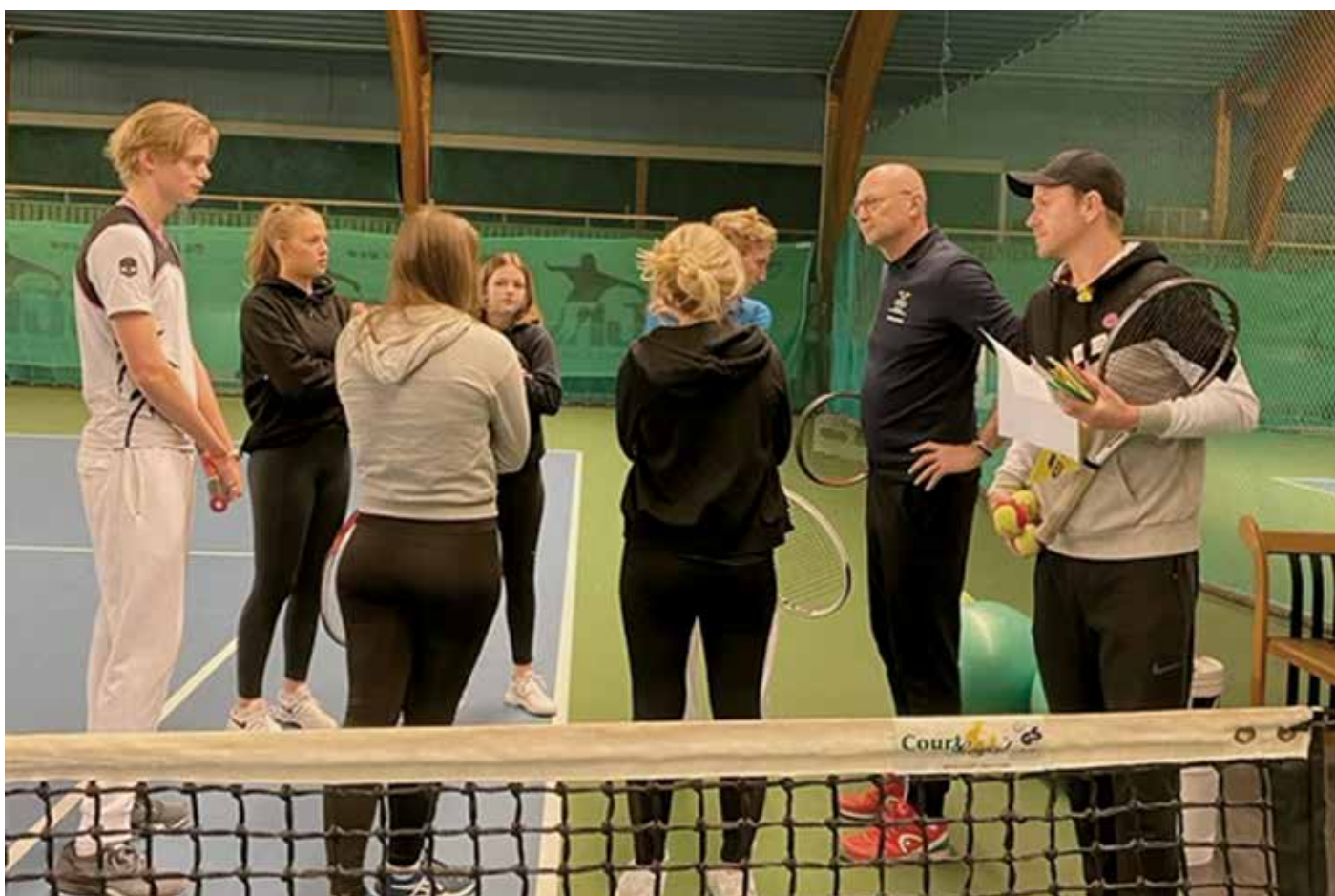
Basträna­rut­bil­dning, planering av lektion.