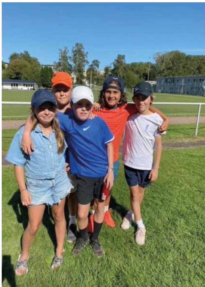
Tävlande RM ute på Mossen augusti 2022.